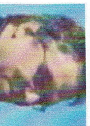
Klaus Kugel organisator activiteiten